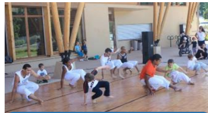
Des activités régulières toute l'année, sport, danse, bien-être, langues...