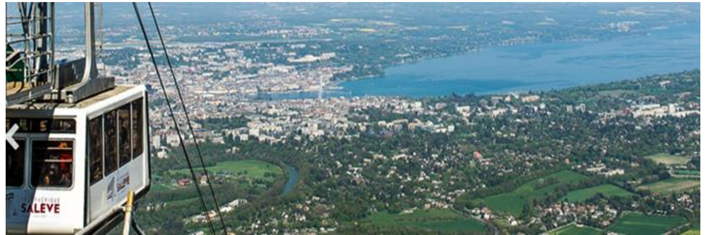
Route du téléphérique 74100 ETREMBIERES