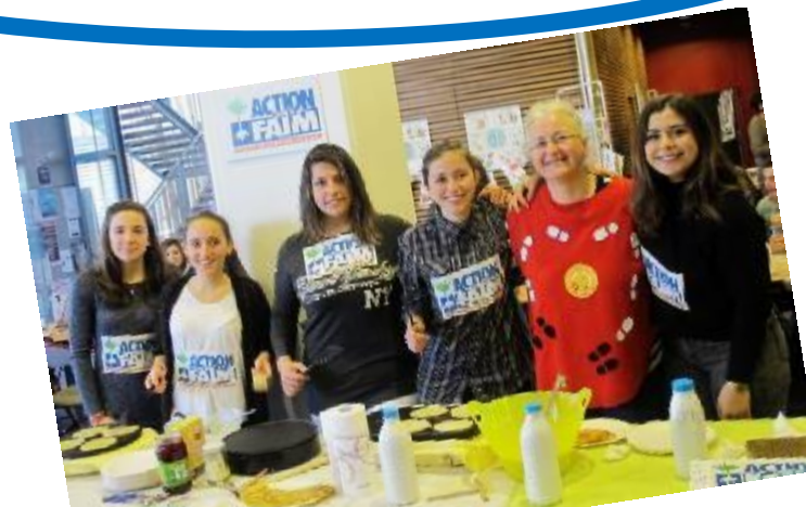
Des actions jeunesse 12-17ans