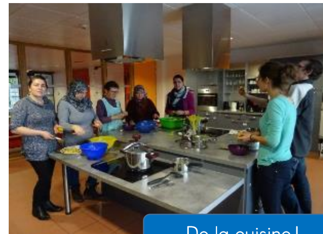
De la cuisine !